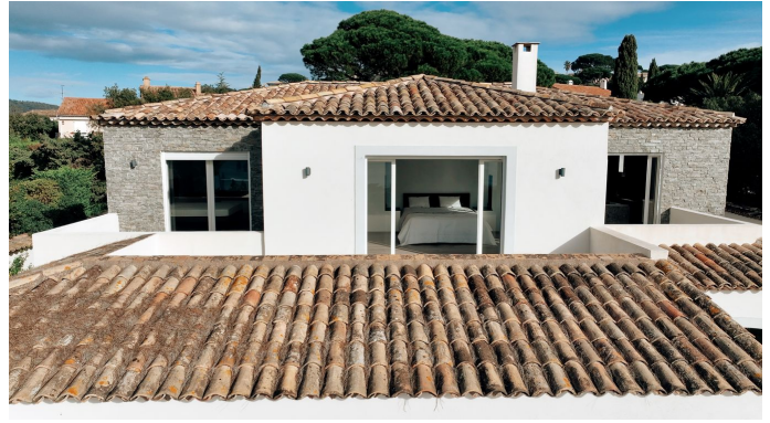
STE MAXIME VUE MER PANORAMIQUE