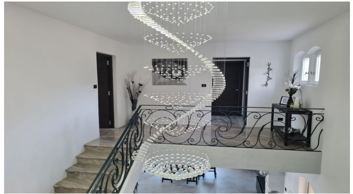
STE MAXIME VUE MER PANORAMIQUE