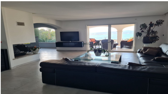
STE MAXIME VUE MER PANORAMIQUE