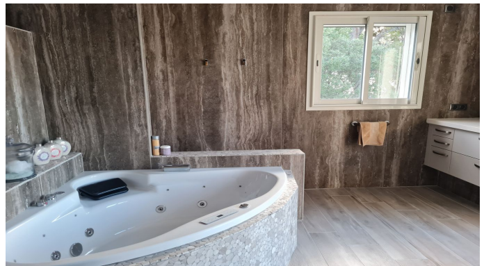
STE MAXIME VUE MER PANORAMIQUE