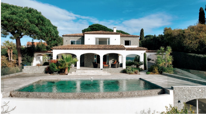
STE MAXIME VUE MER PANORAMIQUE