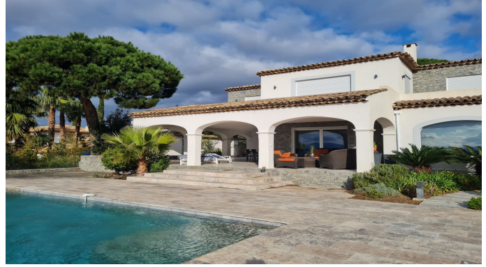
STE MAXIME VUE MER PANORAMIQUE