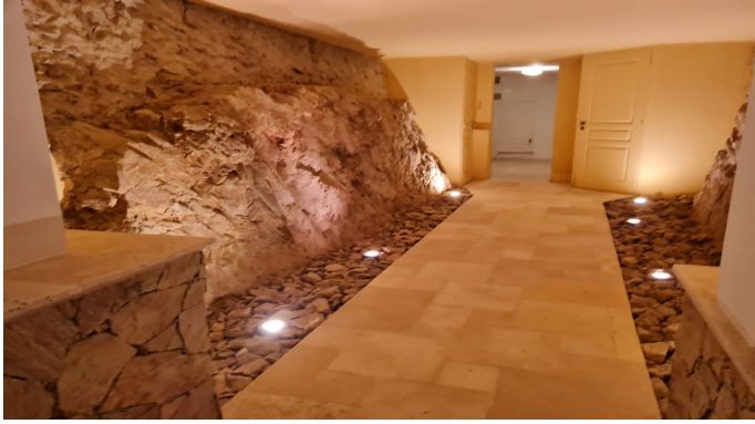
STE MAXIME VUE MER PANORAMIQUE