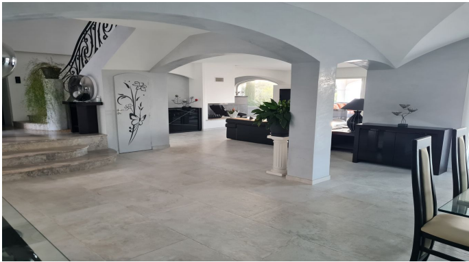
STE MAXIME VUE MER PANORAMIQUE