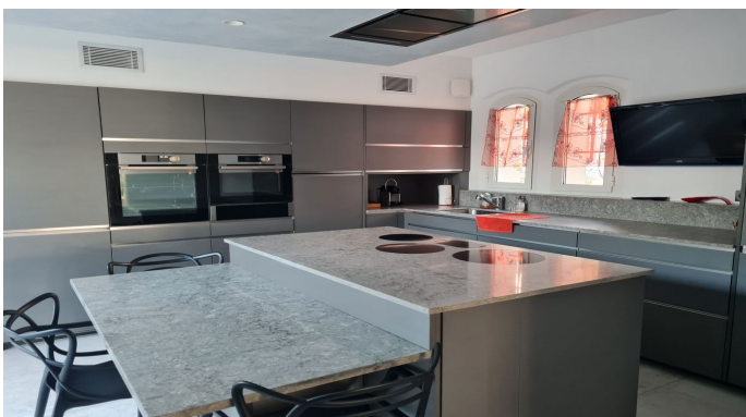
STE MAXIME VUE MER PANORAMIQUE