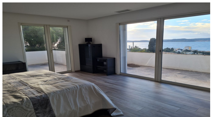
STE MAXIME VUE MER PANORAMIQUE