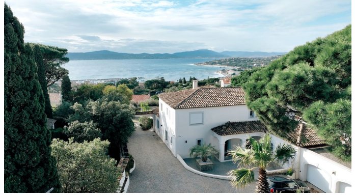
STE MAXIME VUE MER PANORAMIQUE