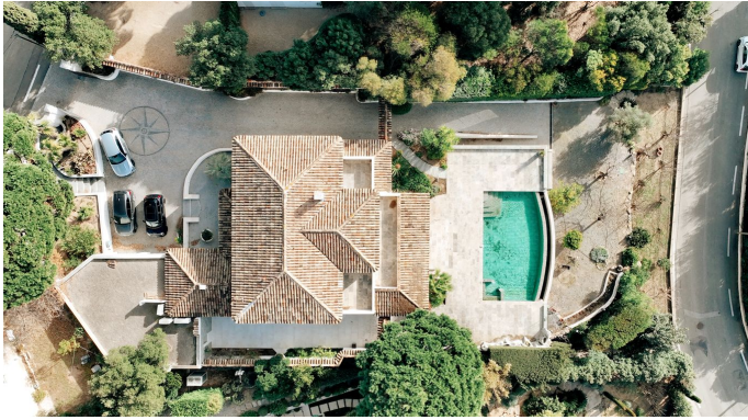
STE MAXIME VUE MER PANORAMIQUE