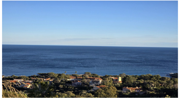
EN ECCLUSIVITE Terrain Exceptionnel avec Vue Mer aux Is