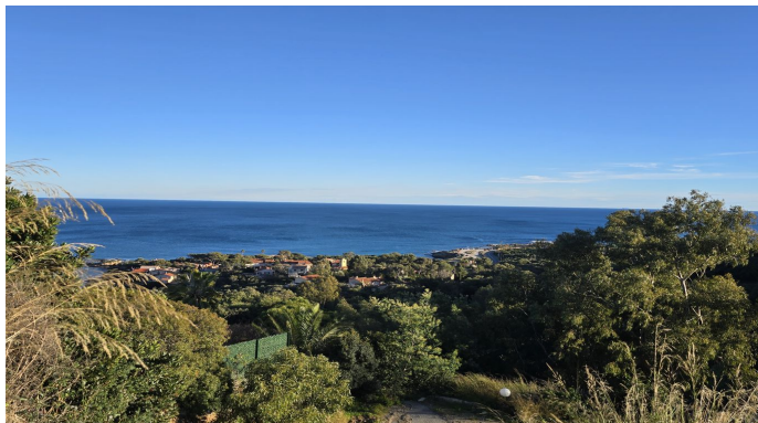
EN ECCLUSIVITE Terrain Exceptionnel avec Vue Mer aux Is