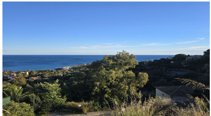
EN ECCLUSIVITE Terrain Exceptionnel avec Vue Mer aux Is