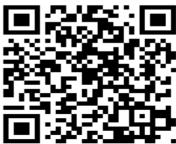
Pour plus de renseignements