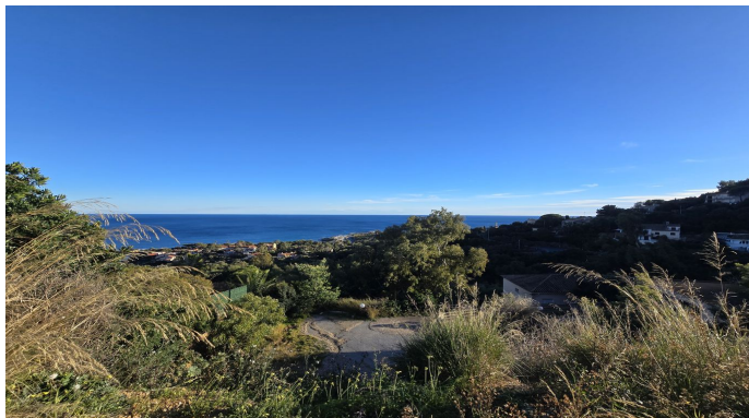
EN ECCLUSIVITE Terrain Exceptionnel avec Vue Mer aux Is