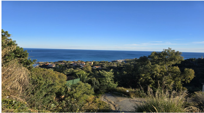
EN ECCLUSIVITE Terrain Exceptionnel avec Vue Mer aux Is