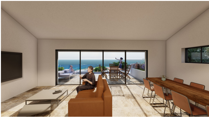
Texte en Français