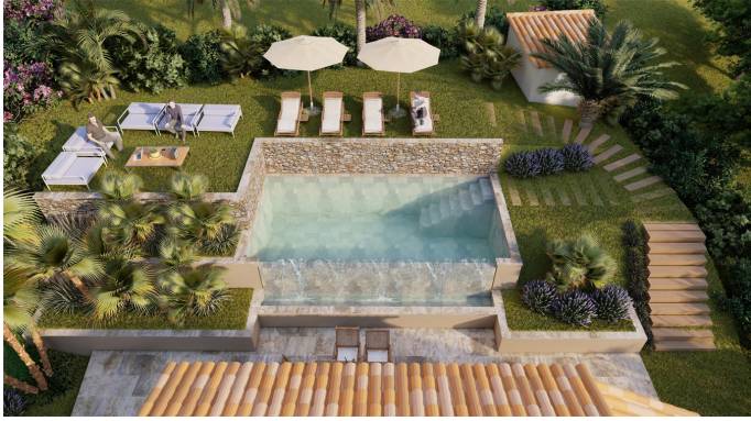
Texte en Français