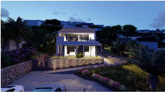
Texte en Français