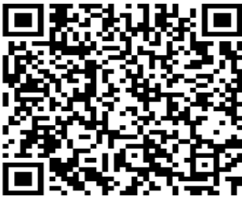
Pour plus de renseignements