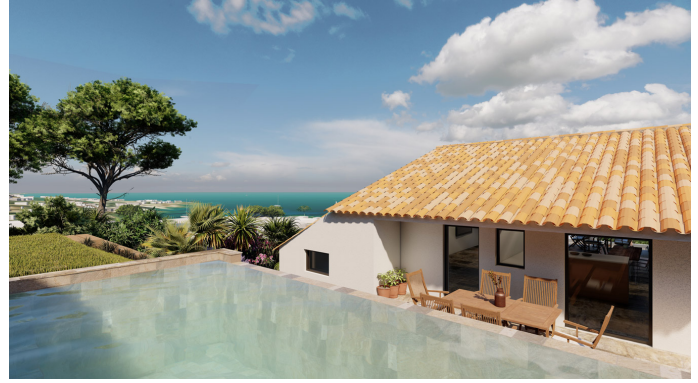
Texte en Français