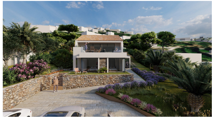
Texte en Français